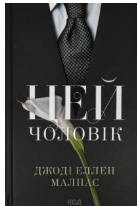
Цей чоловік. Книга 1