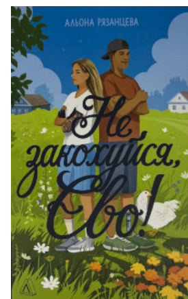
Не закохуйся, Єво!