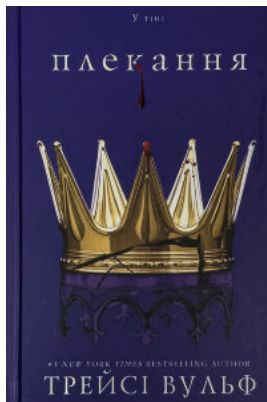
Жага. Книга 6: Плекання