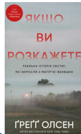
Якщо ви розкажете. Реальна історія сестер, які виростили з матір'ю-вбивцею