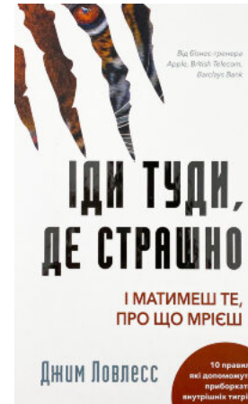
Іди туди, де страшно. І матимеш те, про що мрієш