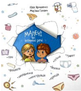
Малечі про інтимні речі