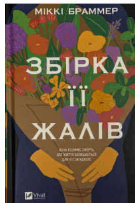
Збірка її жалів