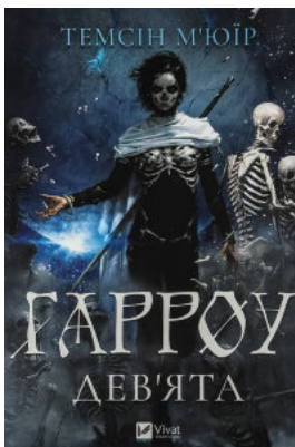
Гарроу Дев'ята (Запечатана гробниця #2)