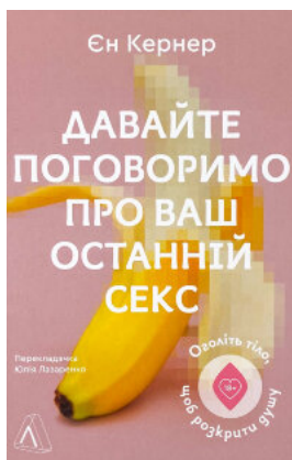
Давайте поговоримо про ваш останній секс. Оголіть тіло, щоб розкрити душу