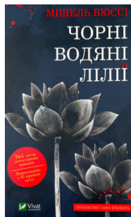
Чорні водяні лілії