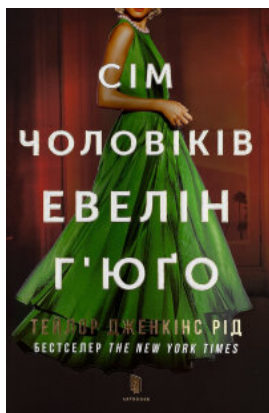
Сім чоловіків Евелін Г'юго