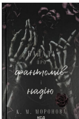
Балада про фантомів і надію