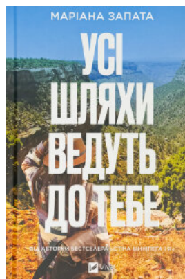
Усі шляхи ведуть до тебе