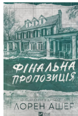
Фінальна пропозиція. Книга 3