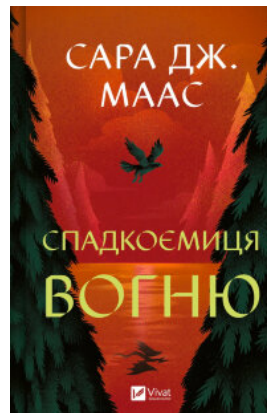
Спадкоємиця вогню. Книга 3