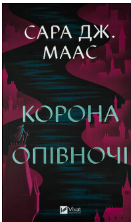
Корона опівночі. Книга 2