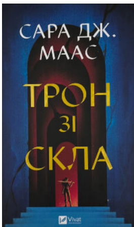
Трон зі скла. Книга 1