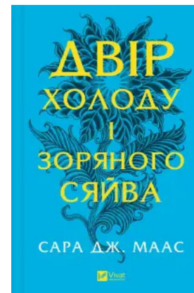
Двір холоду і зоряного сяйва (Двір шипів і троянд #3.5)