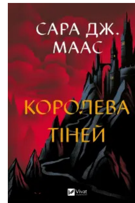
Королева тіней (Трон зі скла #4)