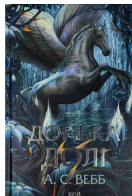
Донька долі. Книга 2