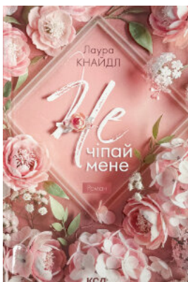
Не. Чіпай мене. Книга 1