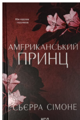
Американський принц. Книга 2