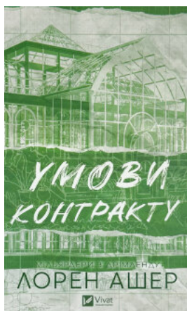
Умови контракту. Книга 2