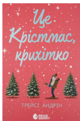
Це Крістмас, крихітко!