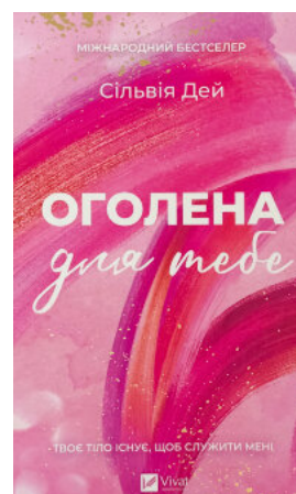
Оголена для тебе. Кроссфайр: книга 1