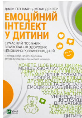
Емоційний інтелект у дитини