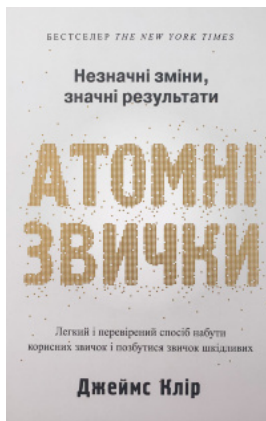
Атомні звички. Легкий і перевірений спосіб набути корисних звичок і позбутися звичок шкідливих