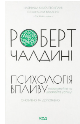
Психологія впливу. Оновлено та доповнено