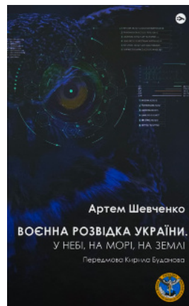
Воєнна розвідка України. У небі, на морі, на землі