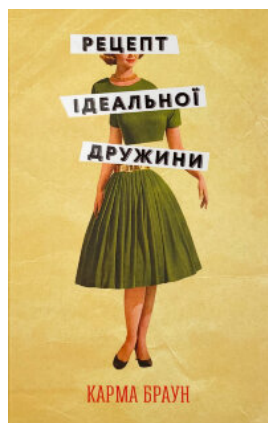
Рецепт ідеальної дружини