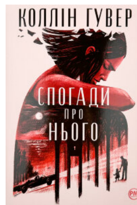
Спогади про нього