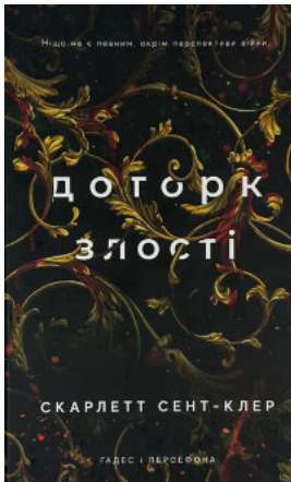
Доторк злості. Гадес і Персефона. Книга 5