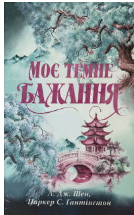
Моє темне бажання. Дорога темного принца. Книга 2