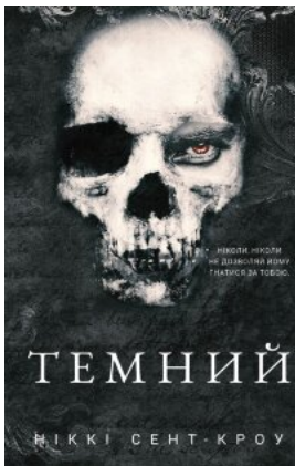
Розпусні загублені хлопці. Книга 2. Темний