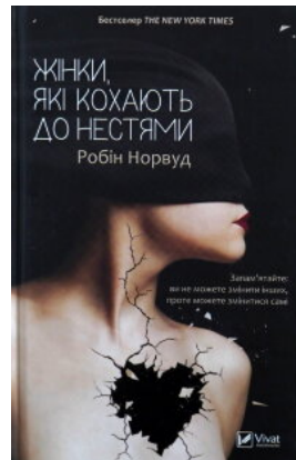
Жінки, які кохають до нестями