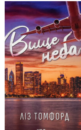
Вище неба. Місто вітрів. Книга 1