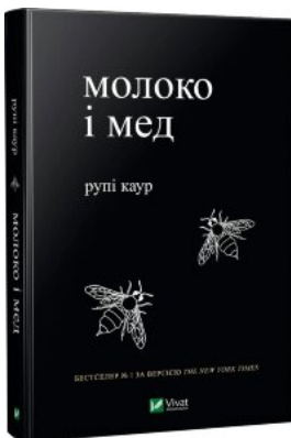
Молоко і мед