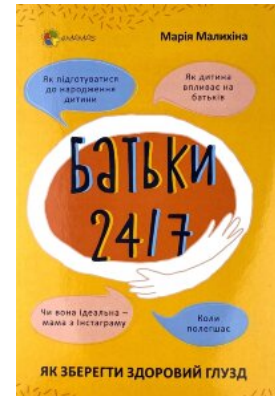
Батьки 24/7. Як зберегти здоровий глузд