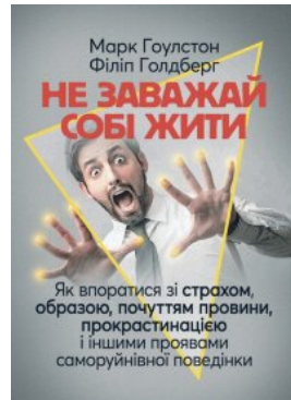
Не заважай собі жити. Як впоратися зі страхом, образою, почуттям провини, прокрастинацією і іншими проявами саморуйнівної поведінки