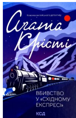
Вбивство у «Східному експресі»