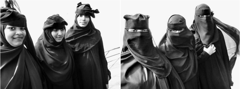
На поромі із Занзібара до Дар-ес-Салама

та дві її подруги взялися застережливо коментувати мій одяг: футболку, довгі штани й куртку. Вони виглядали цілком пристойно, але ж ні, таке носити не можна. Я повинна так само, як і мої супутниці, вбратися в чорну широку одягу й покрити голову, інакше горітиму вічним полум'ям по смерті. Жінки були певні цього.