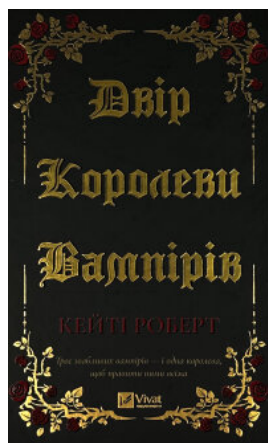
Двір королеви вампірів