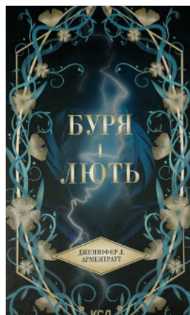
Буря і лють. Книга 1