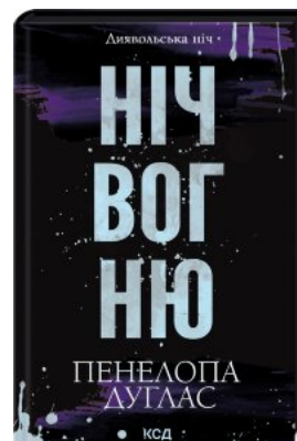
Ніч вогню. Книга 4.5