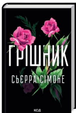
Грішник. Книга 2