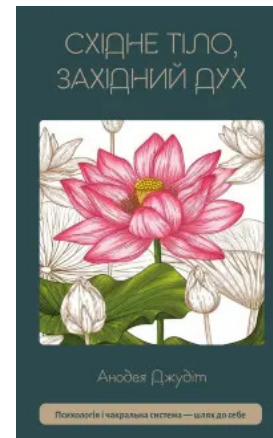
Східне тіло, західний дух. Психологія і чакральна система — шлях до себе