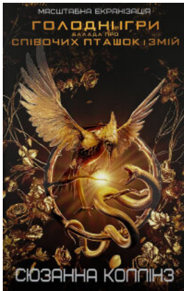
Балада про співочих пташок і змій