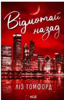
Відмотай назад. Місто вітрів. Книга 5