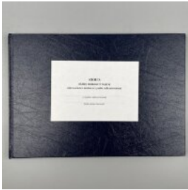
Книга обліку наявності та руху військового майна (служба забезпечення), додаток 46 (додаток 47)