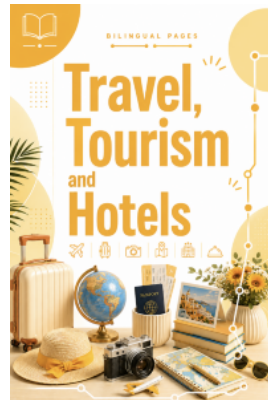
Travel, Tourism and Hotels / Подорожі, туризм і готелі