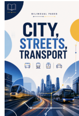
City, Streets, Transport / Місто, вулиці, транспорт