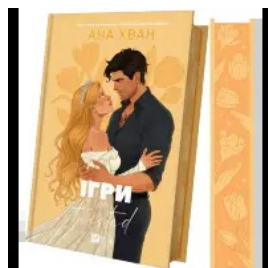
Ігри (Twisted #2)