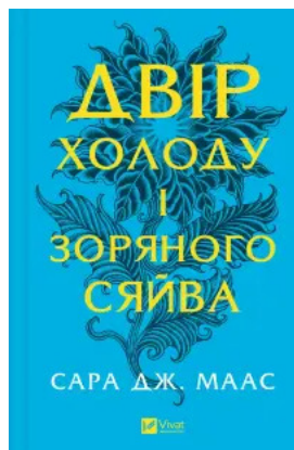
Двір холоду і зоряного сяйва (Двір шипів і троянд #3.5)