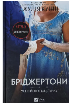
Бріджертони. Усе в його поцілунку