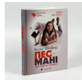
Пес на ім'я Мані, або Абетка грошей