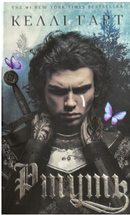
Фейрі й алхімія. Ртуць. Книга 1