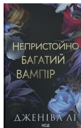
Непристоїно багатий вампір. Книга 1