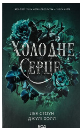
Холодне серце. Книга 1