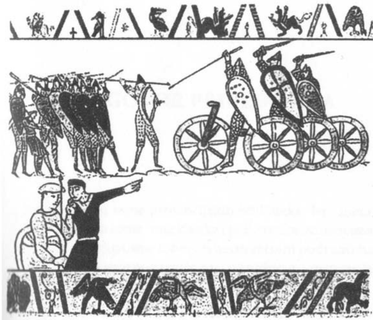
Наскельні розписи фіксують велосипедистів за кільканадцять століть до винайдення велосипеда