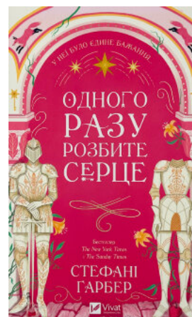
Одного разу розбите серце