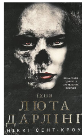
Розпусні загублені хлопці. Книга 3: Їхня люта Дарлінг