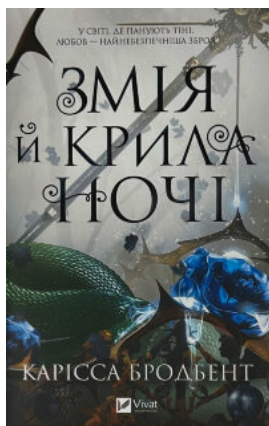
Змія й крила ночі (Корона Ніаксії #1)