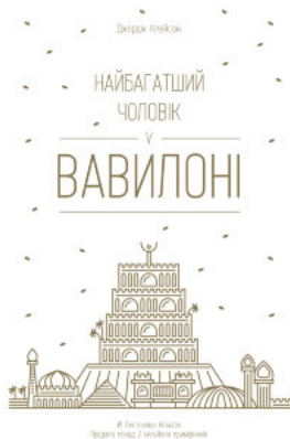
Найбагатший чоловік у Вавилоні