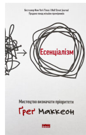
Есенціалізм. Мистецтво визначати пріоритети

Перейти до категорії Саморозвиток та мотивація