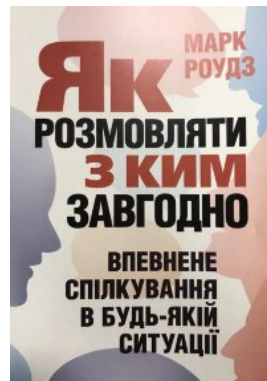
Як розмовляти з ким завгодно. Впевнене спілкування в будь-якій ситуації