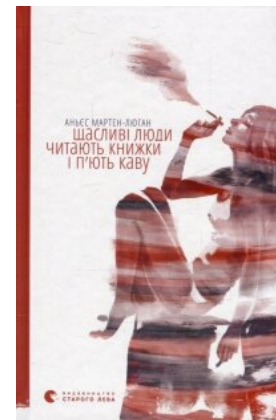
Щасливі люди читають книжки і п'ють каву