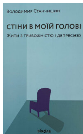
Стіни в моїй голові. Жити з тривожністю і депресією