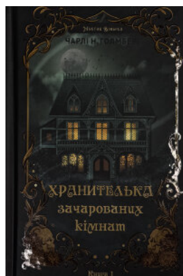
Маєток Вімбрел. Книга 1. Хранителька зачарованих кімнат