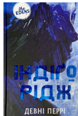
Ідени. Індіго Рідж. Книга 1