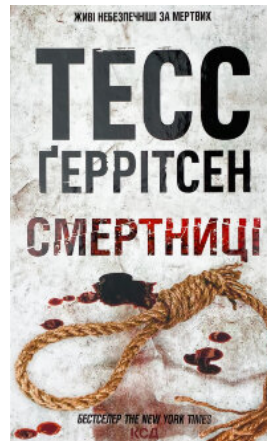
Смертниці. Книга 5