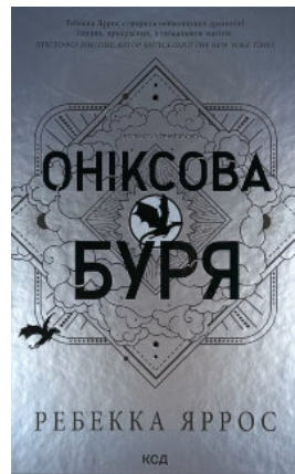
Оніксова буря. Емпіреї. Книга 3