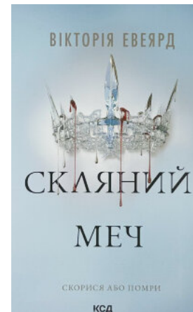
Скляний меч. Книга 2