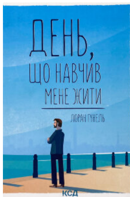
День, що навчив мене жити