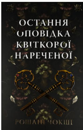
Остання оповідка квіткової нареченої