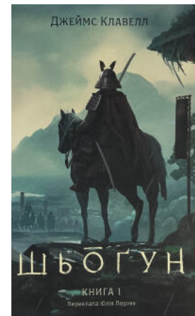
Азійська сага. Книга 1. Шьоґун. Частина 1