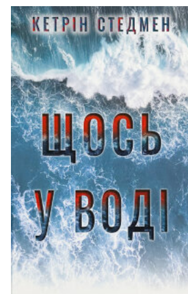
Щось у воді