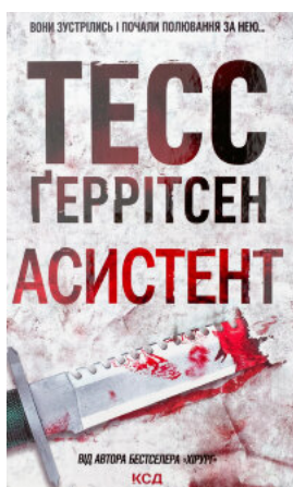
Асистент. Книга 2