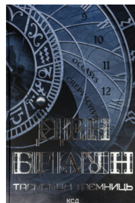
Таємниця таємниць (делюкс видання)