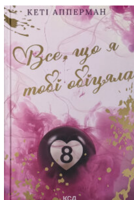
Все, що я тобі обіцяла