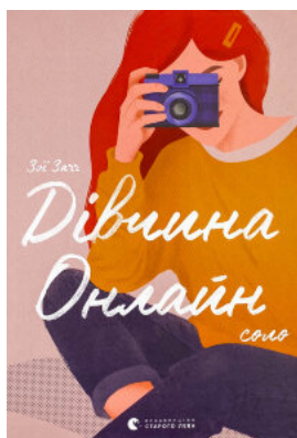
Дівчина онлайн: соло