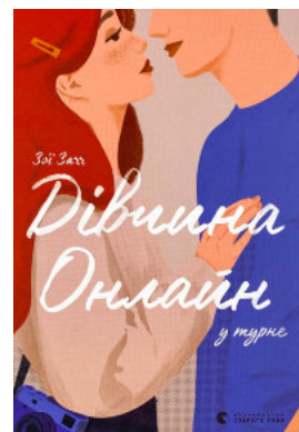
Дівчина онлайн у турне