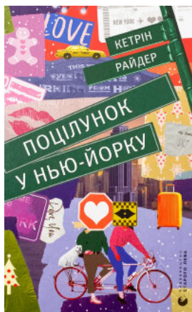
Поцілунок у Нью-Йорку