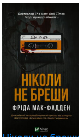
Ніколи не бреші