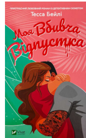
Моя вбивча відпустка