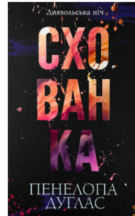
Схованка. Книга 2