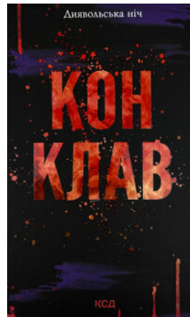
Конклав. Книга 3.5