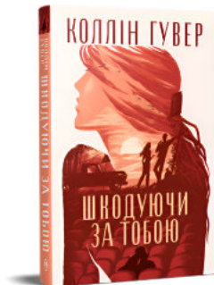
Шкодюючи за тобою