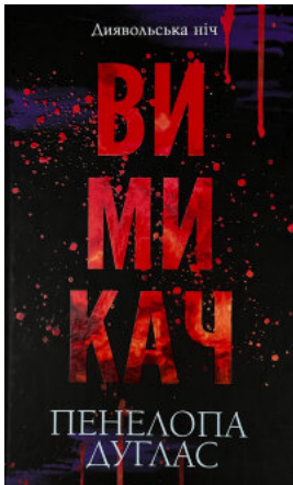
Вимикач. Книга 3