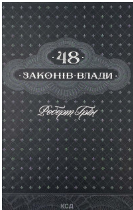
48 законів влади