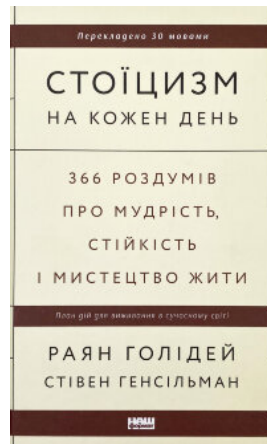
Стоїцизм на кожен день. 366 роздумів про мудрість, стійкість і мистецтво жити