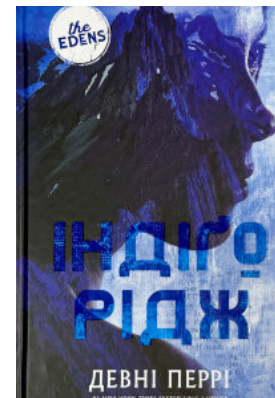
Ідени. Індіґо Рідж. Книга 1