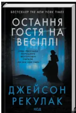
Остання гостя на весіллі