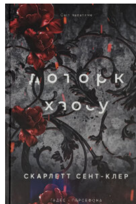
Доторк хаосу. Гадес і Персефона. Книга 7