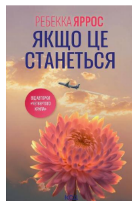
Якщо це станеться