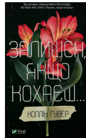
Залишся, якщо кохаєш