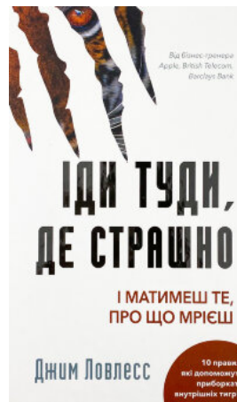
Іди туди, де страшно. І матимеш те, про що мрієш