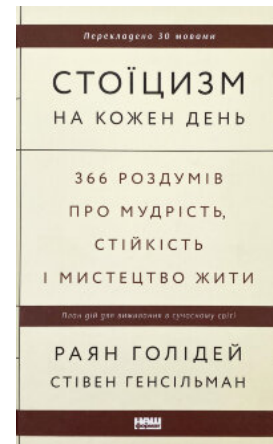
Стоїцизм на кожен день. 366 роздумів про мудрість, стійкість і мистецтво жити