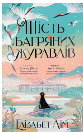
Шість багряних журавлів