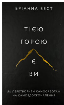
Тією горою є ви. Як перетворити самосаботаж на самовдосконалення