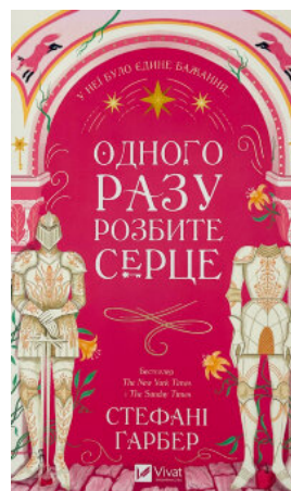
Одного разу розбите серце