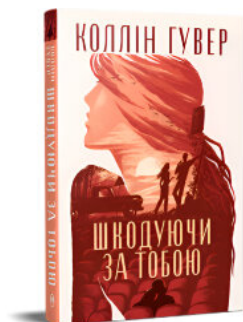
Шкодуючи за тобою