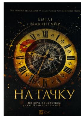
На гачку (Неказкова історія #1)