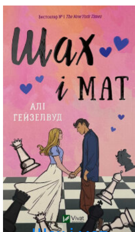
Шах і мат