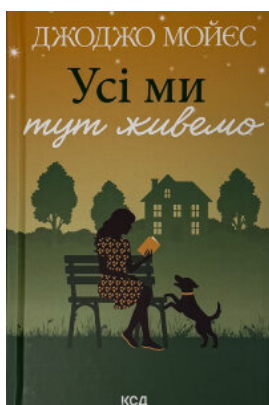
Усі ми тут живемо