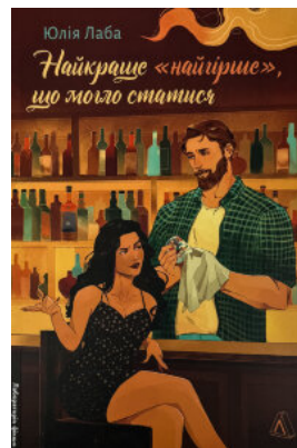
Найкраще «найгірше», що могло статися