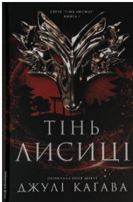
Тінь лисиці. Книга 1