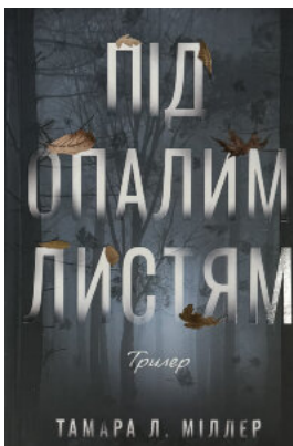
Під опалим листям