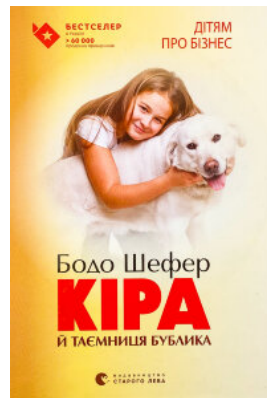
Кіра й таємниця бублика