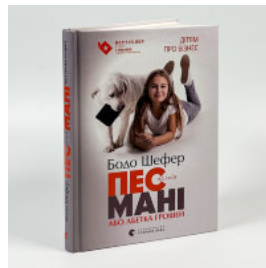
Пес на ім'я Мані, або Абетка грошей