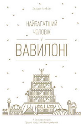
Найбагатший чоловік у Вавилоні