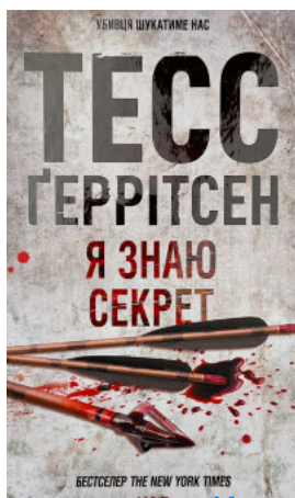
Я знаю секрет. Книга 12