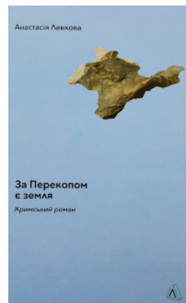
За Перекопом є земля