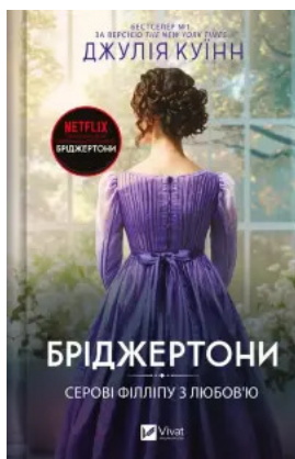
Бріджертони. Серові Філіпу з любов'ю