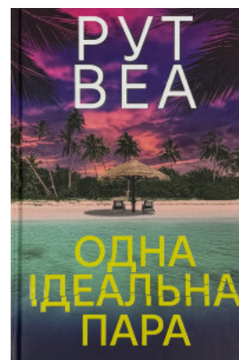
Одна ідеальна пара