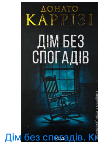
Дім без спогадів. Книга 2