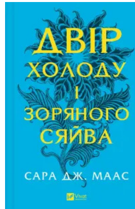
Двір холоду і зоряного сяйва (Двір шипів і троянд #3.5)