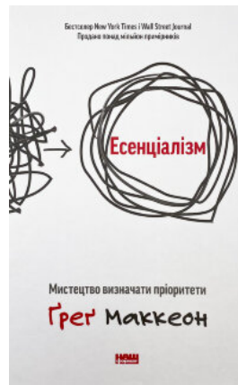
Есенціалізм. Мистецтво визначати пріоритети