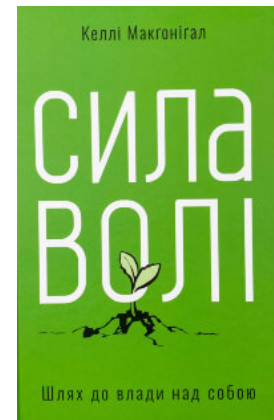
Сила волі. Шлях до влади над собою