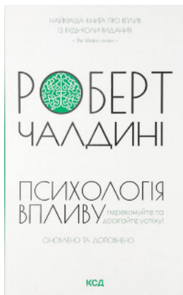
Психологія впливу. Оновлено та доповнено