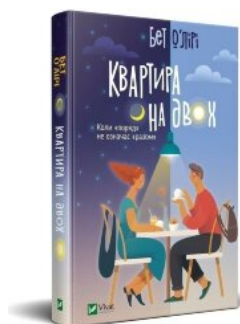
Квартира на двох