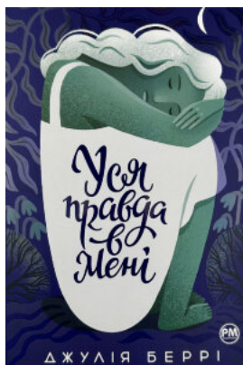
Уся правда в мені