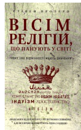
Вісім релігій, що панують у світі: чому їхні відмінності мають значення