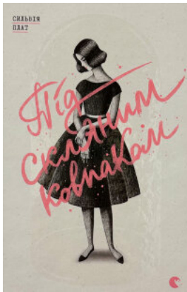
Під скляним ковпаком