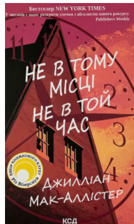
Не в тому місці не в той час